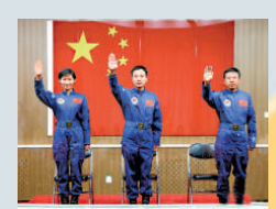
▲ 神州九號印證中國科技發展 資料圖片

● 中國的國家領導人都不斷強調發展科技並將其轉化為生產力的重要性，並為科技發展提供了更多的資金，也提高了科研人員的社會地位。中央政治局常委全體出席中國科學技術協會等科學會議，表現出了中國政府大力支持科技產業發展的堅強決心。