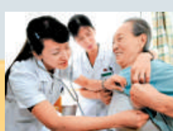
▲ 2009年，中國實行醫療改革 資料圖片

● 2009年，中國實行了醫療改革。13億國人在3年內能夠受益於基本醫療保險。醫療改革能夠最大限度地為最廣泛的群體謀利益，是民生工程的首要任務。艱難的征程才剛剛開始，但改善中國人民醫療條件的努力的確讓夢想一步步實現。