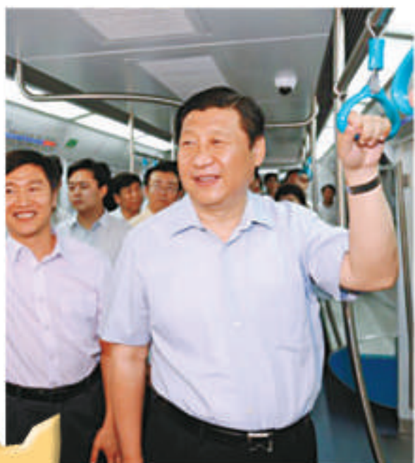
▲ 2005年，時任浙江省省長書記的習近平落區調研 資料圖片

庫恩曾接受中國國務院新聞辦委託，為中國改革30年歷程操刀作傳。他訪問了中國20多個省份的40多個城市，與政界、商界領袖交流，最終寫成了《中國30年——人類社會的一次偉大變遷》一書。