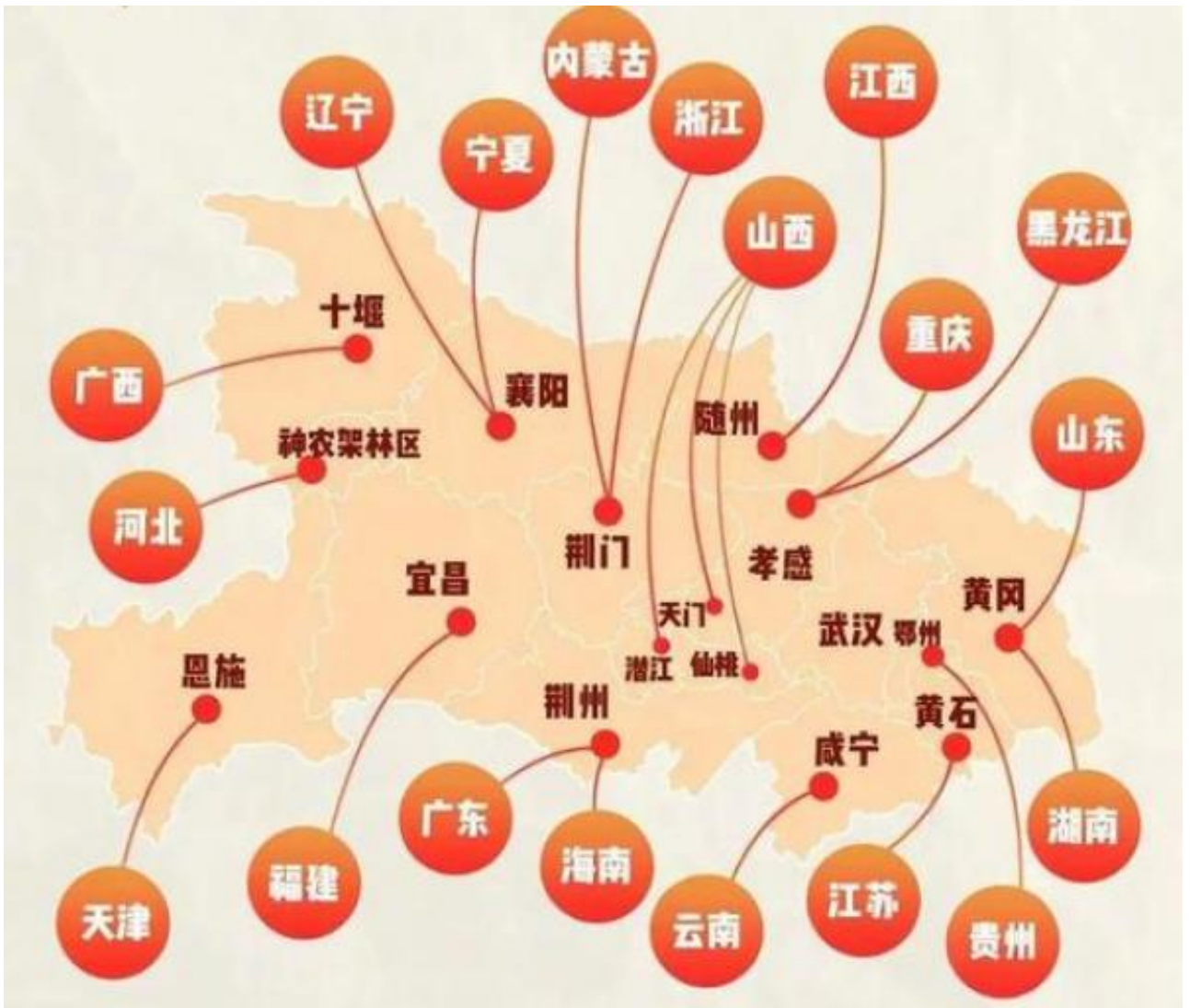
中国 19 个省份医疗队伍对口驰援湖北各地

在疫情防控中，我们要肯定做得好的地方，也要及时改正出错的环节。毕竟一种全新病毒的爆发是无法预防的，而且病毒会变异，可以从动物传染给人，也可以人传人，其蛋白还可以与人体细胞膜蛋白相结合，因此要提前阻止疫情爆发是不太可能的。人们能做的就是尽早发现疫情，防止进一步扩散最后演变成大流行病。虽然一开始贻误了防控时机，但从 1 月 23 日武汉封城等一系列严厉措施开始，疫情逐步得到控制。正如我前面提到的，中国应对新冠肺炎疫情将成为人类历史遏制新疾病传播的典范。