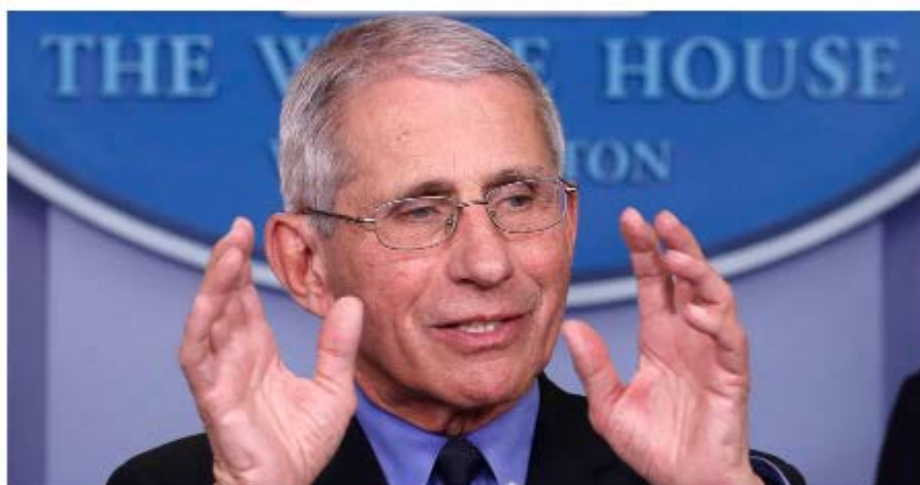
103498 325 新冠肺炎抗疫战 观察员头条 美国新增1.8万例，累计逼近14万